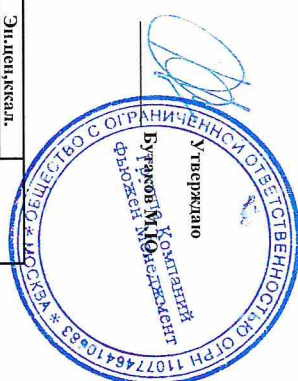
Комплекс горячего обеда одноразового питания стоимостью 60 рублей